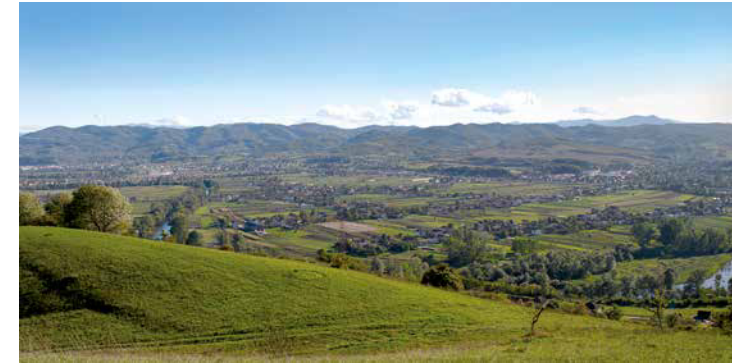
Neolithic settlement landscape in the Visoko Basin, Central Bosnia. Okolište (5200–4700 BCE) is located in the middle of the picture.

Neolithische Siedlungslandschaft, Visokobecken, Zentralbosnien. Okolište (5200–4700 v. u. Z.) befindet sich in der Bildmitte.