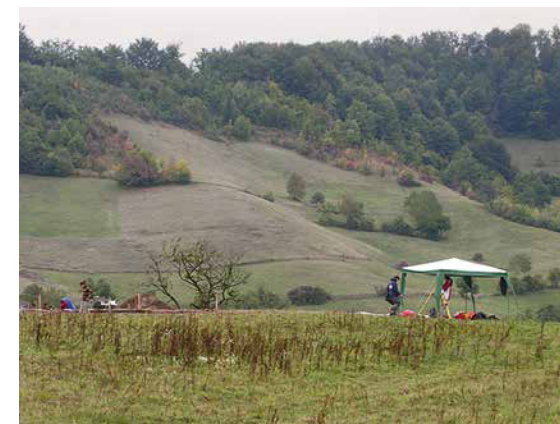
Excavation work in Kundrucci.