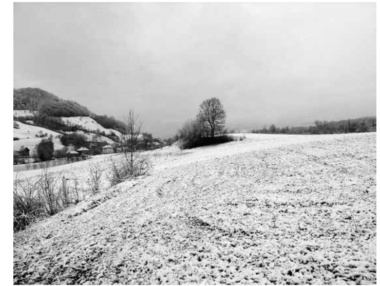
The tell of Kundrucci in winter from the north with a view of the valley and the mountains in the background.

Da es sich um eine sogenannte Tellsiedlung handelt, und die Häuser der nachfolgenden Generationen immer auf den planierten Resten der älteren Bauten errichtet wurden, können wir durch den Vergleich der übereinanderliegenden archäologischen Schichten die sukzessive Veränderung der Siedlungs- und Sozialstruktur gut rekonstruieren. Unsere Ausgrabungen im Jahr 2008 ergaben ein allmähliches Siedlungswachstum sowie die Vereinnahmung des ehemals freien zentralen Platzes und der Bergkristallproduktion durch die Bewohner eines zentralen Hauses in der späten Siedlungsphase. Es sind natürlich verschiedene Szenarien denkbar, aber es erscheint nicht unplausibel, dass wir hier Hinweise auf wirtschaftlich-soziale Konflikte sehen, die schließlich zur Aufgabe der Siedlung um 4700 v. u. Z. führten.